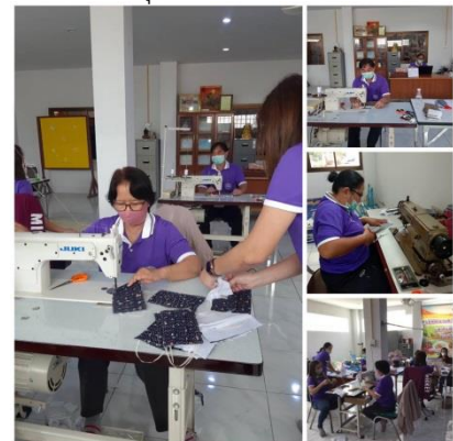
โครงการพลังคนไทยร่วมใจป้องกันไวรัสโคโรนา (COVID-๑๙) และละออง PM ๒.๕