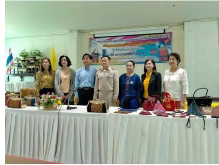
อบรมเชิงปฏิบัติการการพัฒนาสินค้าหนึ่งตำบลหนึ่งผลิตภัณฑ์ (OTOP)