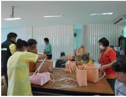
ฝักอบรมอาชีพ