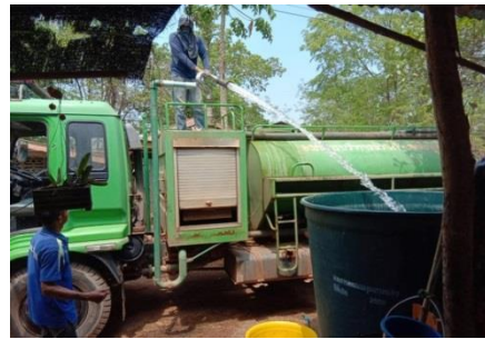
การป้องกันและบรรเทาสาธารณภัย