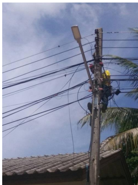
โครงการขยายเขตไฟฟ้าสาธารณะ และเปลี่ยนโคมไฟฟ้าสาธารณะ