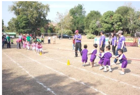
โครงการแข่งขันกีฬาศูนย์พัฒนาเด็กเล็กสัมพันธ์