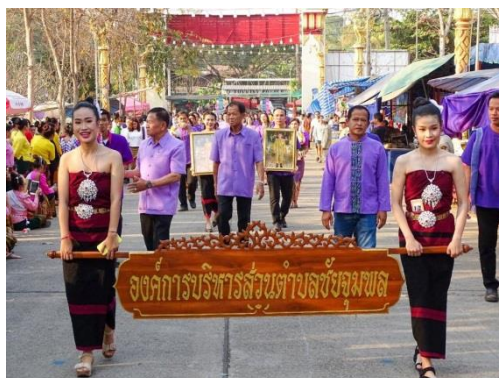
โครงการส่งเสริมทำนุบำรุงพระพุทธศาสนางานนมัสการพระแท่นศิลาอาสน์