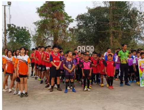
โครงการจัดการแข่งขันกีฬาตำบลชัยภูมิ