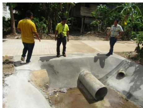
ก่อสร้างรางระบายน้ำคอนกรีตเสริมเหล็ก /วางท่อระบายน้ำ