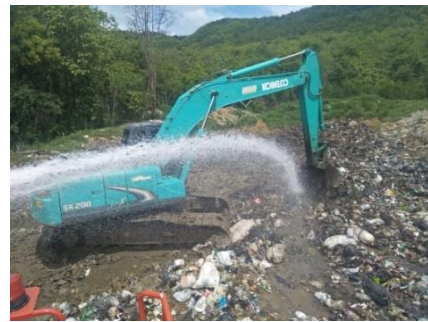
ฝังกลบขยะมูลฝอยแบบประยุกต์