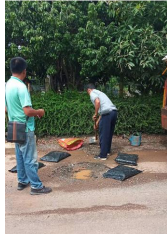
การปรับปรุง/ซ่อมแซม โครงสร้างพื้นฐานในตำบลชัยภูมิพล