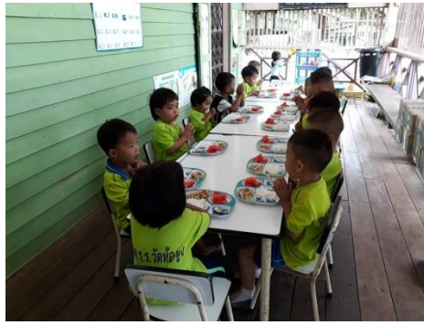
จัดหาอาหารกลางวันศูนย์พัฒนาเด็กเล็ก และอุดหนุนอาหารกลางวันโรงเรียน