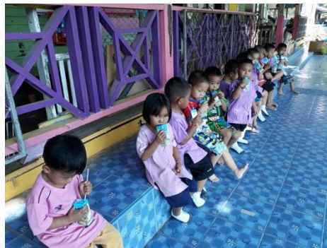
จัดหาอาหารเสริม(นม) ศูนย์พัฒนาเด็กเล็กและโรงเรียน