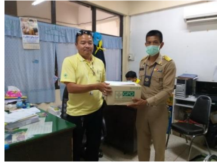
โครงการศูนย์ป้องกันและปราบปรามยาเสพติด อบต.ชัยจุมพล