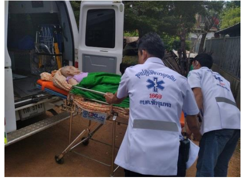
งานแพทย์ฉุกเฉิน (EMS) อ.ต.จ.ชัยภูมิ