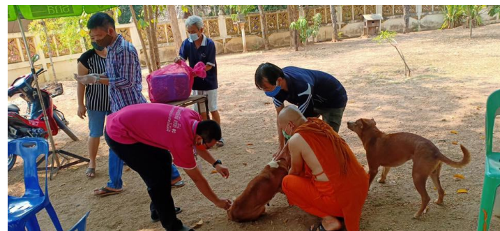
โครงการควบคุมป้องกันการแพร่ระบาดของโรคพิษสุนัขบ้า