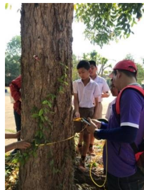
โครงการอนุรักษ์พันธุกรรมพืชอันเนื่องมาจากพระราชดำริ ฯ