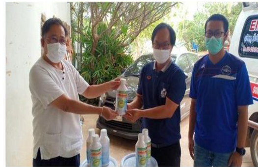
โครงการณรงค์ป้องกันการแพร่ระบาดของโรคไข้เลือดออกในเขตตำบลชัยชุมพล