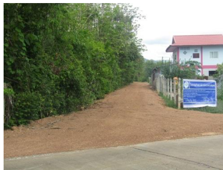
ก่อสร้างถนนคอนกรีตเสริมเหล็ก และถนนลูกรัง