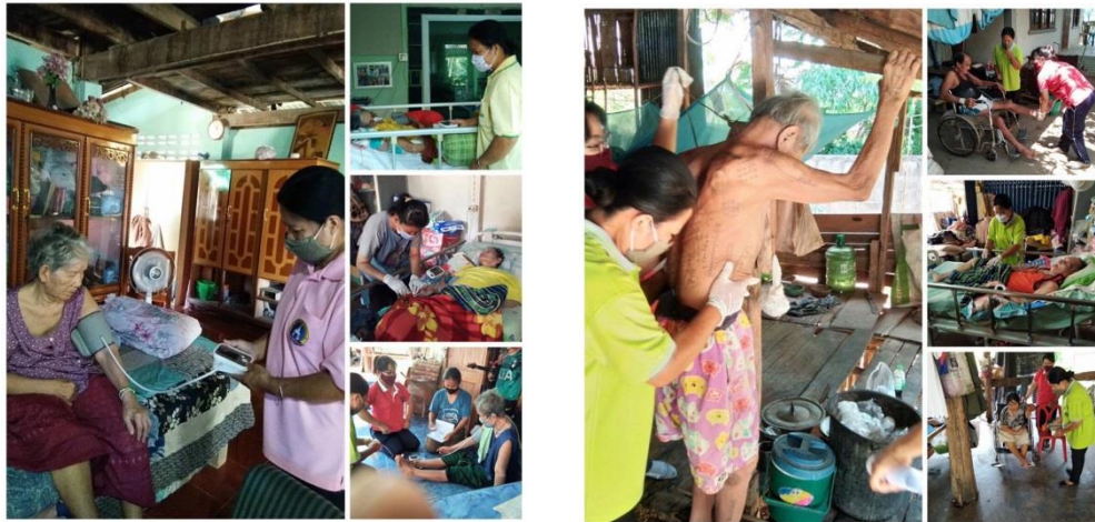
งานอาสาบริบาลท้องถิ่น